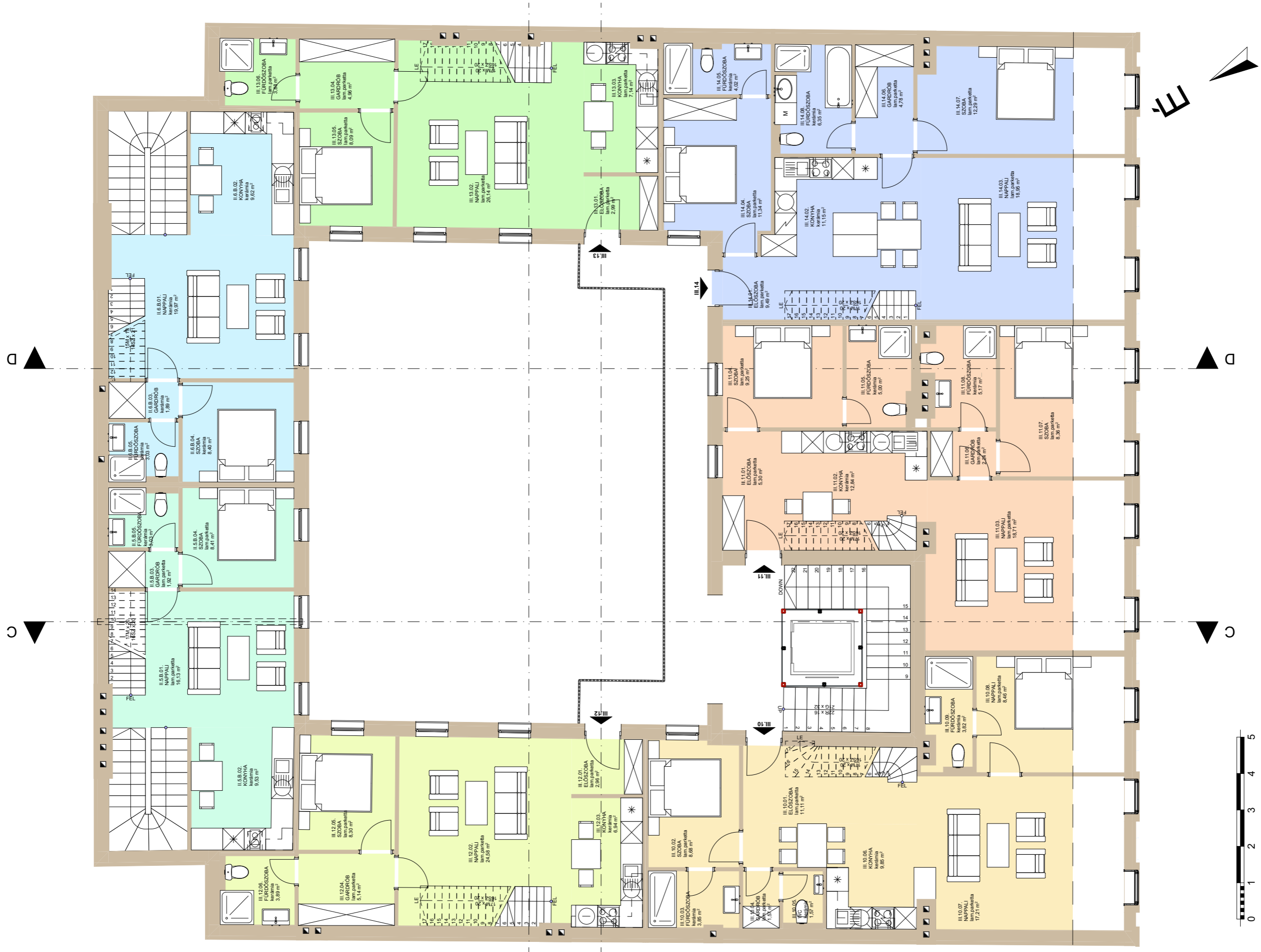
Hársfa u. 59, (hrsz: 34044) Marketing terv_Tetőter alaprajz M 1:100